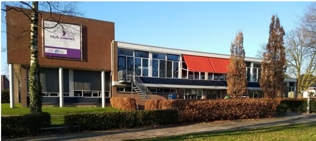
Paus Johanneschool aan de Floraparkstraat in Enschede