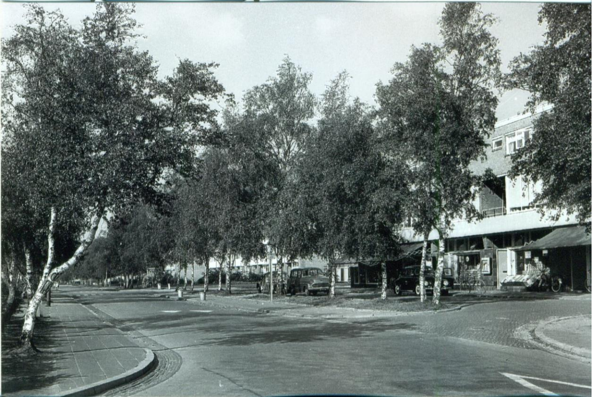
Kruidenierszaak van De Gruyter aan de Warmeerweg in Emmen. In de flat links achter de auto heb ik gewoond.

Als kind kreeg ik zaterdags een dubbeltje zakgeld. Maar vaak had ik al op woensdag zin in iets lekkers. Ik vroeg mijn moeder dan op die dag om het dubbeltje van zaterdag en liep meteen naar de winkel van Jamin (wij zeiden altijd Sjamin). Een blok vanille-ijs, kostte precies een dubbeltje. En als we eens vijf cent meer kregen konden we een ijsje gehuld in chocolade kopen.