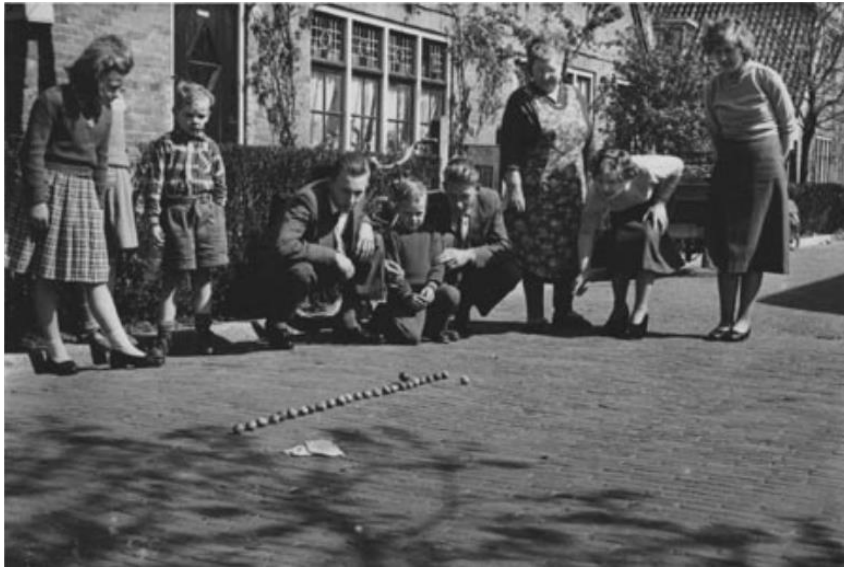
Foto gemaakt in Groningen in 1957. De personen op de foto zijn geen familie.