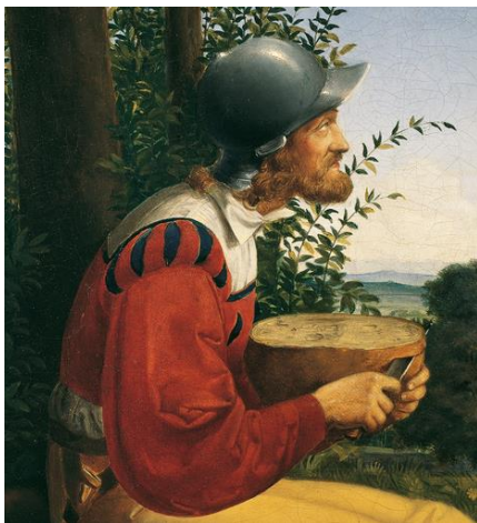
'Christian' op het schilderij 'Der Brotschneider' van de Oostenrijke schilder Moritz von Schwind (1823)