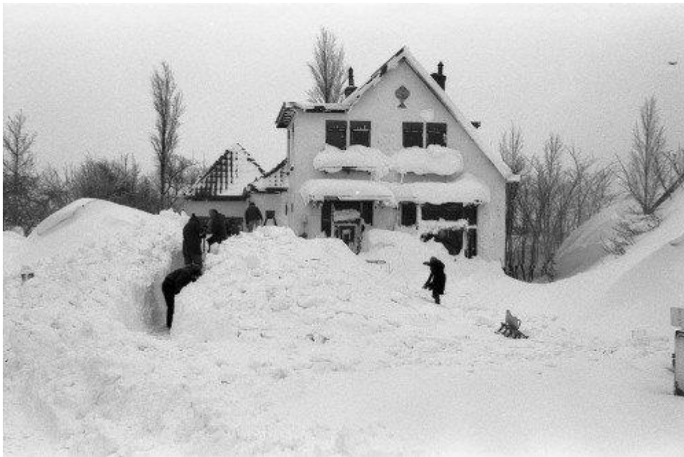
Zuidhorn in februari 1979

De sneeuwstorm van woensdag 14 februari 1979 was zelfs de zwaarste sneeuwstorm van de 20e eeuw in Nederland. Waarnemers spraken over dikke gordijnen van voortjagende sneeuw. Buitenshuis was het in de voortjagende sneeuw bij vijf graden vorst en een ijzig koude wind niet te harden. Bij sommige woningen stooft de sneeuw op tot het dakraam, hoogspanningsdraden sneuvelden en zelfs de snelwegen raakten volledig geblokkeerd. Complete dorpen werden voor meerdere dagen van de buitenwereld afgesneden. Toch viel er niet eens zoveel sneeuw. Probleem was de aanhoudende stormachtige wind met vlagen van 100 km/uur die ongeveer 90 uur achtereen zorgde voor zware driftsneeuw die over grote afstanden werd meegevoerd. De sneeuwduinen die daardoor ontstonden bereikte hoogtes van 3 tot 6 meter.