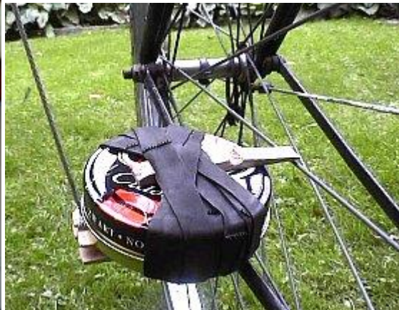
Een van onze 'hobby's' als kind was het fietsen met een stukje hard karton dat met een wasknijper zodanig op het frame werd vastgeklemd dat deze 'klepper' bij het fietsen een ratelend geluid maakte. Rechts een variant.