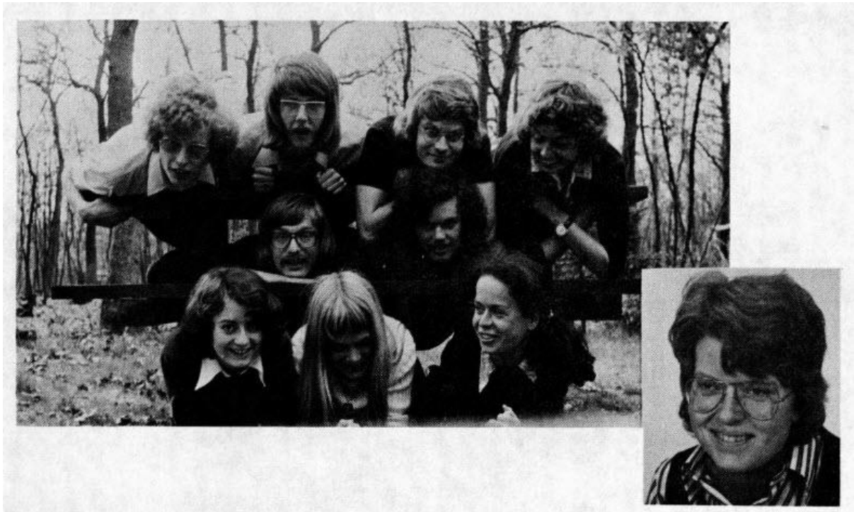
Het oude en nieuwe bestuur van het GHD Ubbo-Emmius