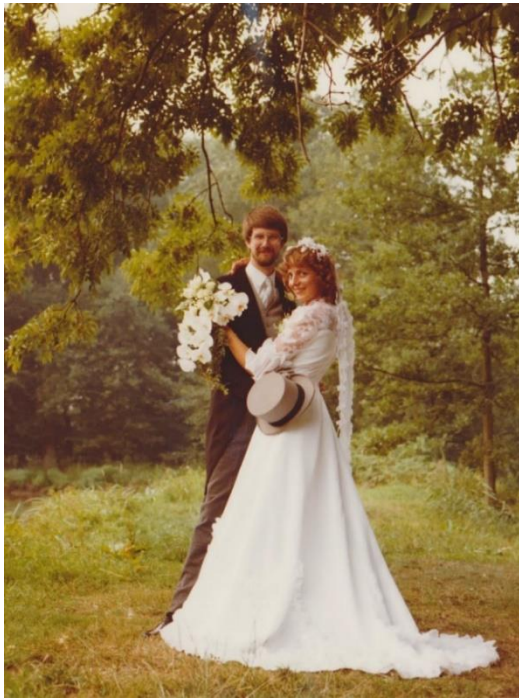
22 september 1982. Foto genomen bij Watermolen Frans in Vasse.