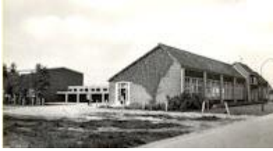
Groen van Prinstererschool in Emmen.

zaten die waarschijnlijk naar het lyceum gingen. Door deze klas hoefde ik geen toelatingsexamen te doen voor het Christelijk Lyceum in Emmen.