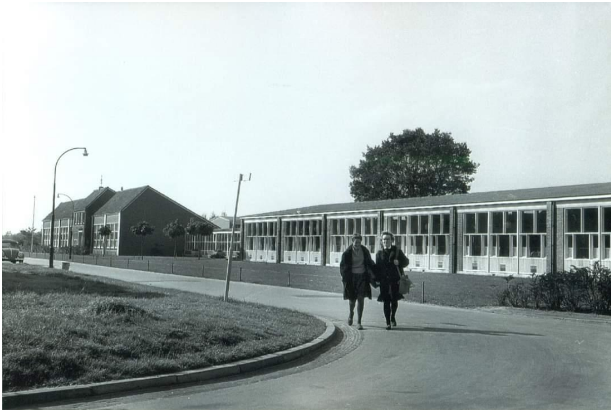
De Groen van Prinstererschool in de tijd dat ik er op school zat.