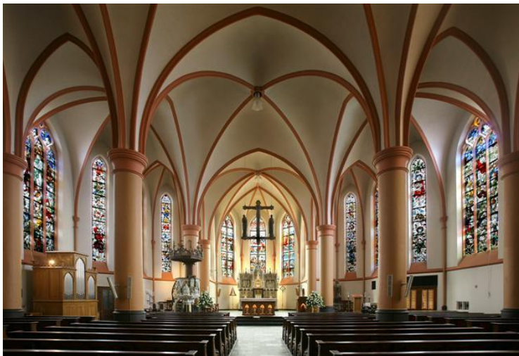
Interieur van de Pancratiuskerk in Tubbergen.