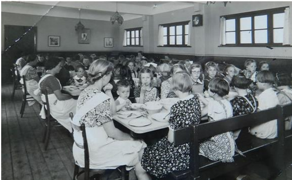
Vakantiekolonie Elim op Schiermonnikoog.