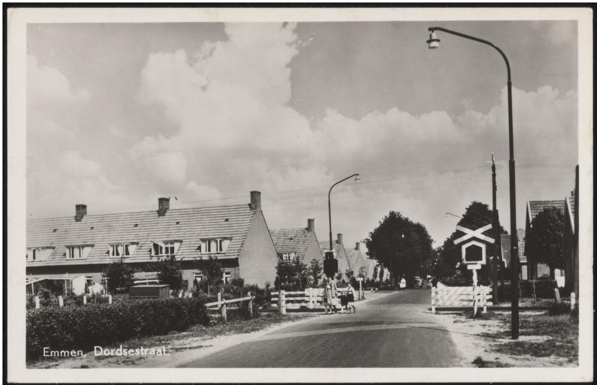
Vlak voor de overgang, rechts, stond de winkel/het huis waar ik geboren ben.