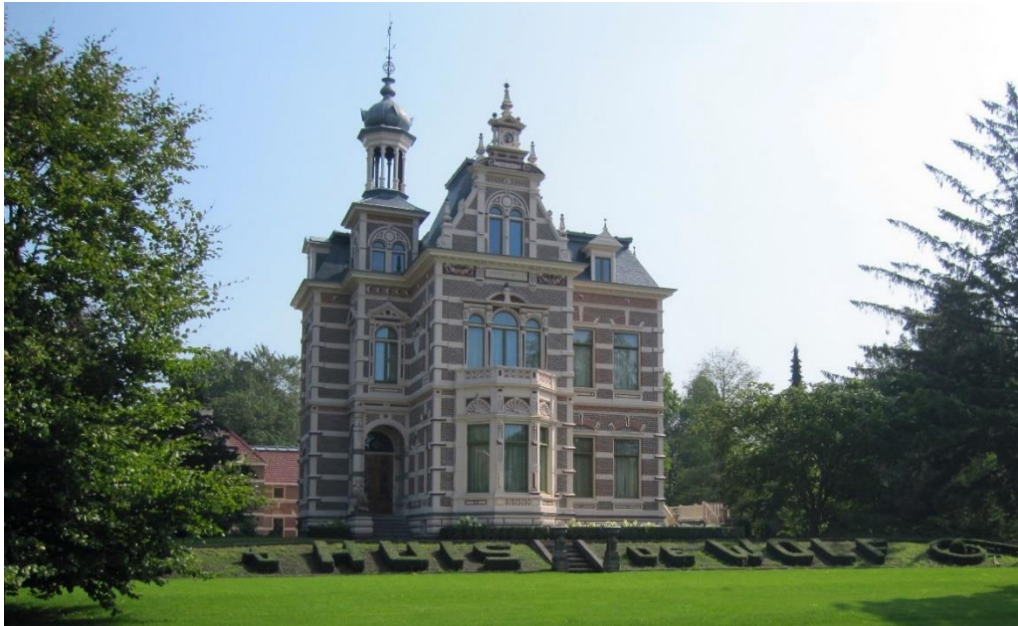
Instituut voor polemologie in Haren.