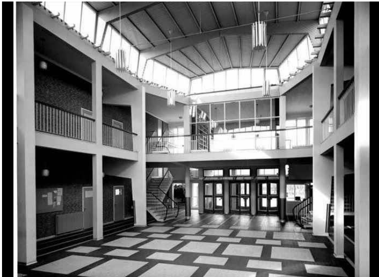
Aula van het Christelijk Lyceum met boven in het midden de bibliotheek waar wij het 'vonnis' (de uitslag van het examen) moesten afwachten.