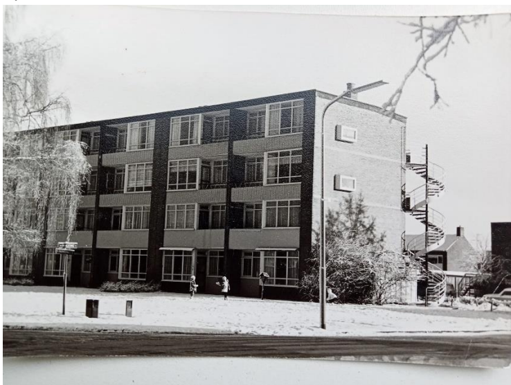
Warmeerweg in Emmen. Dit waren de eerste flats in Emmen. 2 In de flat rechtsonder (eerste en

Op 21 oktober 1962 verhuisden we naar de Warmeerweg 50. In hetzelfde flatgebouw woonden mijn opa en oma, Albert en Alida.