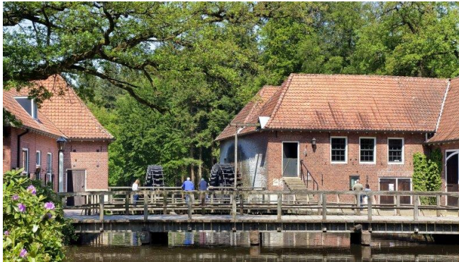
Watermolen Sinkgraven in Denekamp