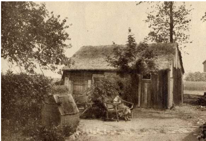
Schuur in Angelslo in 1936.

In 2005 werd de wijk als verouderd gezien en was herstructurering noodzakelijk. Vanwege de bijzondere karakteristiek is Angelslo aangemerkt als planologisch en stedenbouwkundig erfgoed. 4