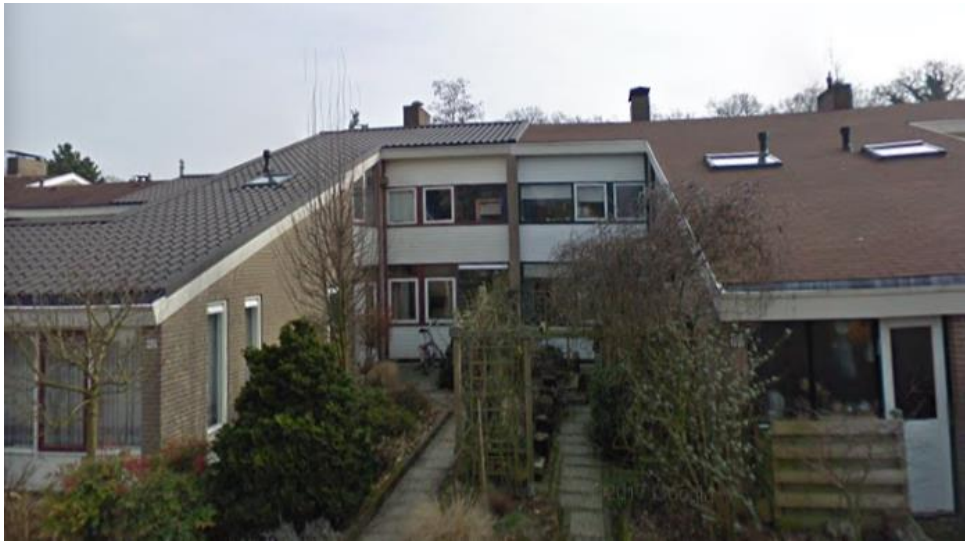
Weemhoffhorst 40 in Enschede (het linker huis).