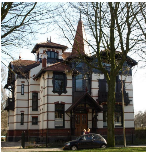
Instituut voor geschiedenis, Heresingel Groningen