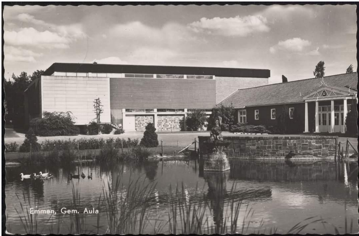
Gemeentelijke Scholengemeenschap aan de Oosterstraat in Emmen.