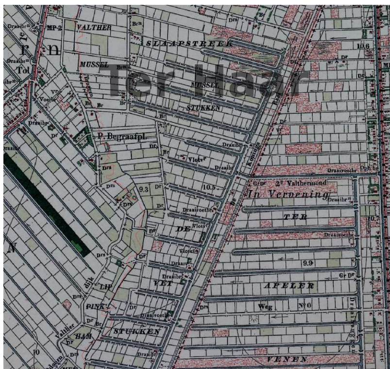
Slaapstreek en De Vetstukken.