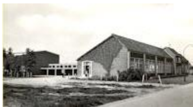
Groen van Prinstererschool in Emmen.