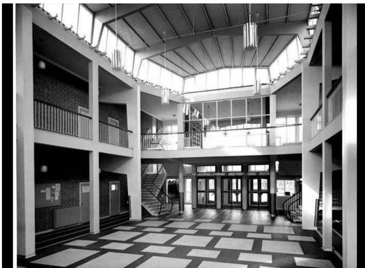
Aula van het Christelijk Lyceum met boven in het midden de bibliotheek waar wij het 'vonnis' (de uitslag van het examen) moesten afwachten.