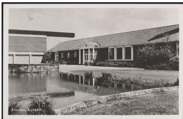
Het Openbaar Lyceum, later de Gemeentelijke Scholengemeenschap (GSG) in Emmen.

Vierentwintig sollicitaties leidden uiteindelijk in 1979 (ik was in militaire dienst in juni van dat jaar afgestudeerd) tot een baan op het Dr. A. Ariënscollege in Enschede. Niet mijn droombaan, maar ik had geen alternatieven. Het werd wel het begin van mijn belangstelling voor didactiek. Zeker toen een leerling eens tegen mij zei: 'Meneer, doe niet zo ingewikkeld, we zitten hier niet op de universiteit' . Een jaar later zei een leerling van de toenmalige driejarige mavo: 'Meneer, bent u doctorandus, u ziet er helemaal niet zo geleerd uit' . Nadat ik in 1987, samen met een collega, een lesboek over staatsinrichting had geschreven 'Publieke Tribune', werd ik in 1990 naast mijn werk op school, ook kaderdocent voor KPCGroep. Hier kreeg ik de kans lesmateriaal te ontwikkelen en nascholingen te verzorgen. Zo schreef ik met een collega 'Nederland in de steigers', opnieuw een methode voor staatsinrichting. In de tweede helft van de jaren negentig werd ik door KPCGroep enkele dagen in de week uitgeleend aan Meulenhoff in Amsterdam. Voor deze educatieve uitgever was ik projectleider van examenkaternen en van de methode Pharos. In 1996 maakte ik, na een fusie, de overstap naar het Jacobus College in Enschede. Al snel werd de naam van de school, na een fusie met het protestantse Ichthuscollege, veranderd in Bonhoeffercollege. Hier gaf ik voor het eerst ook les in de bovenbouw van havo en vwo, niet alleen in geschiedenis, maar ook een paar jaar Klassieke Culturele Vorming.