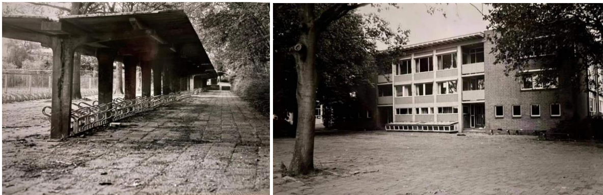
De achterkant van de school met de fietsenstalling.