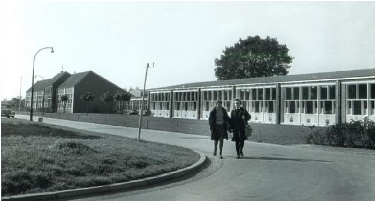
De Groen van Prinsterschool in de tijd dat ik er op school zat.