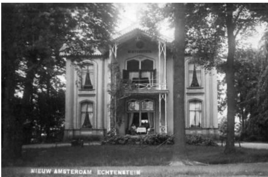
Villa Echtenstein in 1877