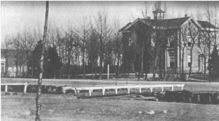
Villa Echtenstein rond 1900