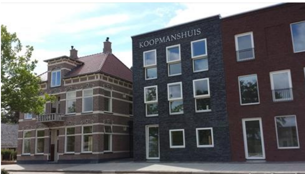
Koopmanshuis in Nieuw-Amsterdam.