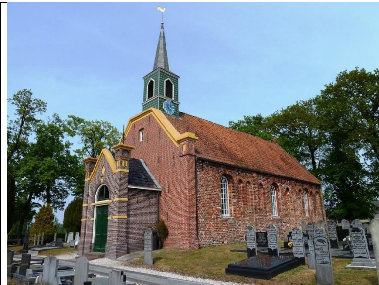
Nederlands Hervormde kerk in Nuis.

In het jaar duizend achthonderd negen en vijftig, den achttienden der maand April , zijn voor ons Burgemeester _____, Ambtenaar van den Burgerlijken Stand der gemeente Harsum _____, Arron- dissement en Provincie Groningen , verschenen Kornelis Jans Haren, berg. _____, oud vijfen vyftig jaren, van beroep landbouwer , wonende te Nuis _____, van de overledene, en Oege Ates Adema , oud vijfenveertig jaren, van beroep Winkelier , wonende te Nuis _____, na buur _____ van de overledene, welke ons hebben verklaard, dat op den zestienden der maand April _____, des jaars duizend achthonderd negen en vijftig, des voornedlags _____ te half elf uur, binnen deze gemeente, en wel te Nuis _____, is overleden Elste Karstens van der Kaap oud meurestig jaren, van beroep arbijster . _____, laatst gewoond hebbende te Nuis , geboren te Tolbert , weduwe van Louwe Leetjens vander Lee , dochter van Karst Jacobs van der Kaap en Baetjke Harms Mulder , beide overleden: _____