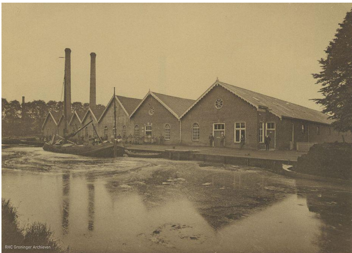
Strokkartonfabriek 'Union' in Oude Pekela, ca. 1910.