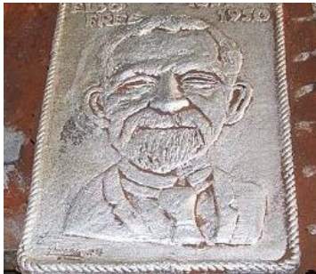
Tinnen gedenkplaat, 10 september 2016.

In de ontmoetingsruimte van de Pekelder erfgoedstichting Siepco aan de plaatselijke H. Westerstraat werd ter ere van de in Duitsland geboren technicus en handelaar een tinnen afgietsel gemaakt van zijn beeltenis. Op dezelfde dag werd in dezelfde ruimte een kunstwerk onthuld met daarop onder andere een foto en een gedrukte tekst van en over de in 1950 overleden ondernemer.