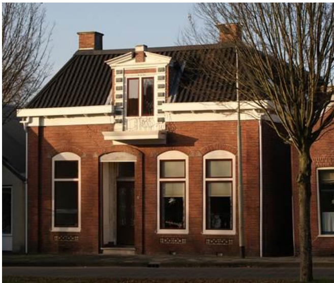
Het woonhuis van Elso Free, zoals het er in 2009 uitzag.