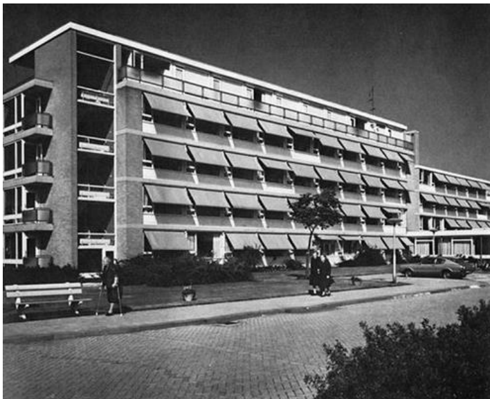
De Holdert in de jaren zeventig.