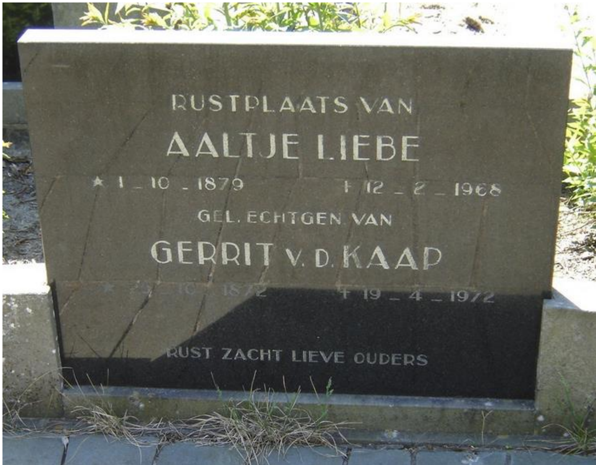
Graf van Gerrit en Aaltje in Nieuw-Weerdinge.