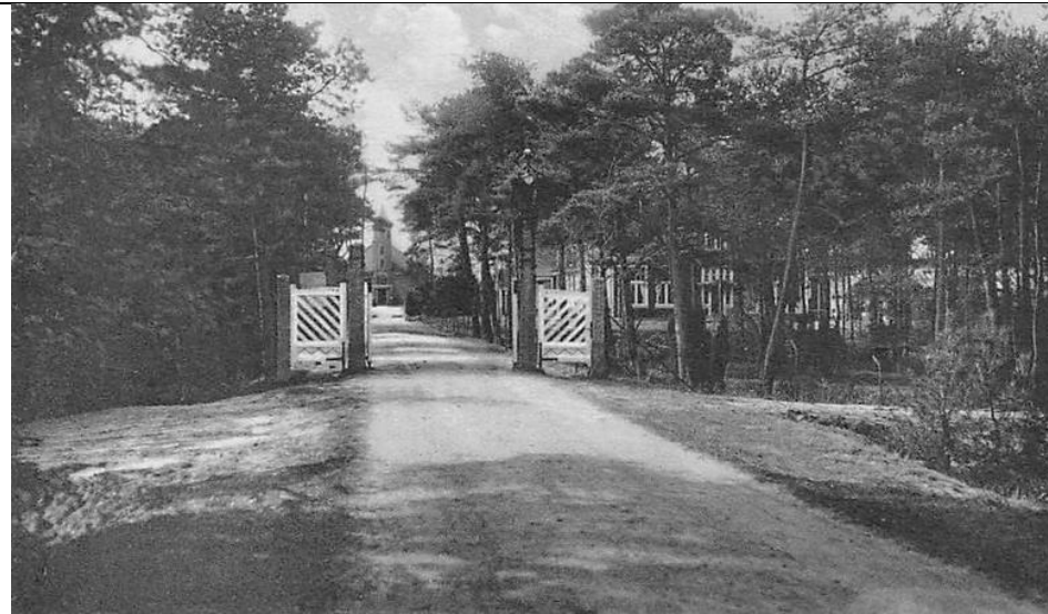
Ingang sanatorium Appelscha.