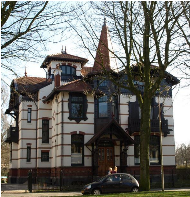
Instituut voor geschiedenis, Heresingel Groningen

De Amsterdamse architect Abraham Salm, kreeg de opdracht een villa te ontwerpen. Na het gereedkomen werd de villa door haar alpine-uiterlijk algemeen aangeduid als het 'Zwitserse huis'. In 1966 kwam het pand in bezit van de Rijksuniversiteit Groningen, die er kortstondig de afdeling 'Franse taal- en letterkunde' in huisvestte, en vervolgens de historici, waarna het ook nog het onderkomen was van polemologen.