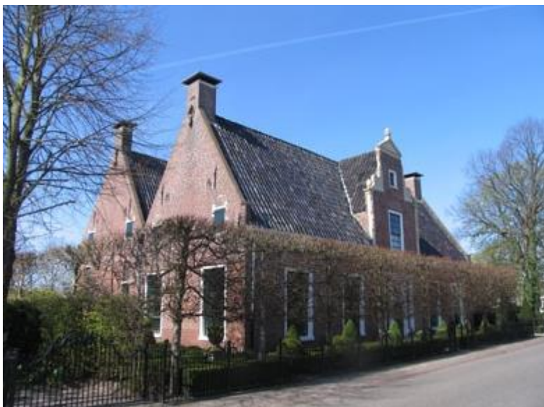
Nijsinghuis in Eelde.