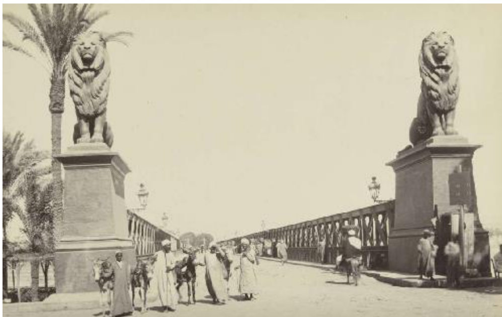
De Kasr el nil aan de oever met twee leeuwen beelden op de kop van de brug. Pascal Sébah, ca. 1888 - ca. 1898.