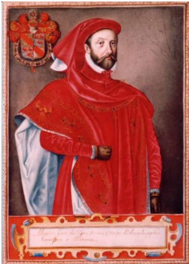
Jean de Ligne, graaf van Aremborg.

In 1561 ging het huis over in handen van Johan de Ligne, graaf van Aremborg (1525-1568), en Margareta van der Marck, met wie hij in 1547, door toedoen van keizer Karel V, was getrouwd. In het huwelijkscontract was geregeld dat Jan de naam en het wapen van Aremborg zou overnemen. Dit alles inclusief de jaartaks, drie vaten boter, hoenderpacht, het Weertshuis, de windmolen, in het huis aanwezige geschut en munitie en drie stukken grof geschut in Groningen. Philips II gaf hier toestemming voor en dus kreeg Westerwolde een Spaansgezinde leenheer. Schenck zou gedurende zijn leven een lijfrente van 1400 gulden per jaar ontvangen. Karel Schenck overleed echter voor de eerste vervaldag van de overeenkomst. Stadhouders Jan de Ligne kreeg het leen dus min of meer als 'geschenk'.