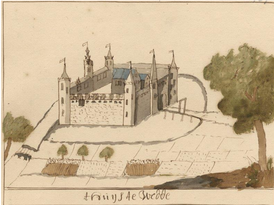
De Wedderborg rond 1700.