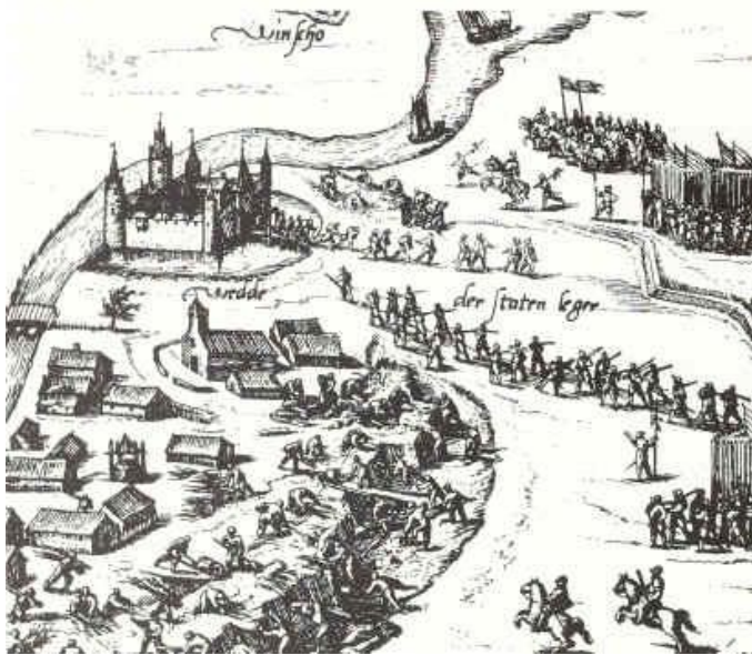
De inname van de borg te Wedde, 30 augustus 1593.

De jaren daarna werd de borg meerder malen geplunderd door zowel Spaans als Staatse legers. Op 30 augustus werd de borg definitief ingenomen door Willem Lodewijk.