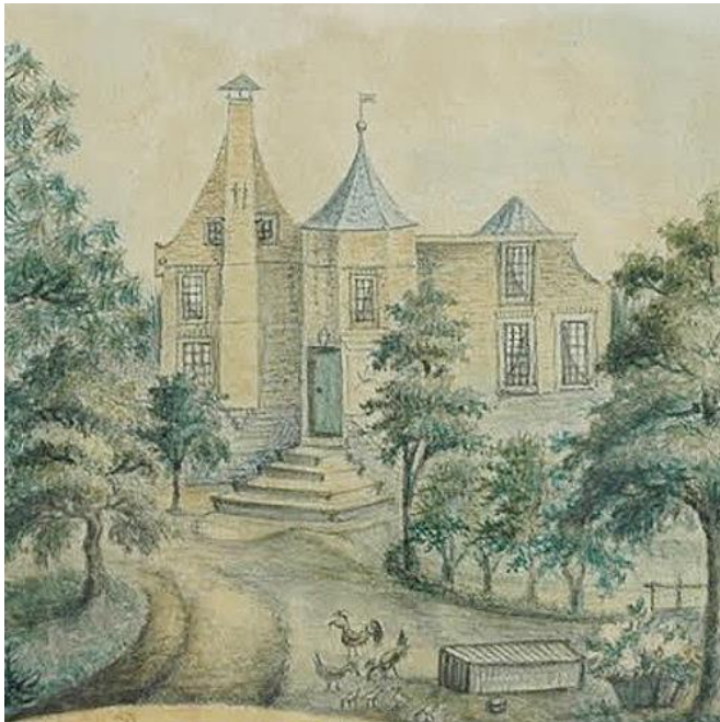
Huis te Wedde.

Als het Reiderland in de nacht van 15 op 16 januari 1362 door de (tweede) Marcellusvloed deels door het water wordt verzwoegen en Westerwolde nagenoeg aan zee komt te liggen vraagt de in het Reiderland woonachtige familie van hoofdelingen (of jonkers) Addinga aan de abt van het klooster Corvey (aan de Weser) of ze land 'in leen' kan krijgen. Egge Addinga krijgt toestemming om op een van de landen in het stroomdalgebied van de Westerwoldse Aa een steenhuis te bouwen.