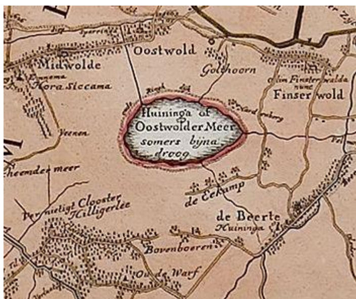
Het Huninga of Oostwolder Meer.

Dit meer lag in een van de noordelijkste uitlopers van het Bourtangerveen en ontstond tussen 1488 en 1513 toen grote delen van het veen wegspoelden als gevolg van overstromingen vanuit de uitdijende Dollard.