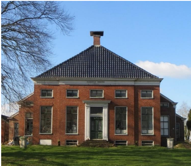
De Huningaborg in Beerta.

Na de dood van zijn schoonvader in 1623 ging Sebo op de Tiddingaborg bij Beerta wonen die later de Huningaborg zou gaan heten. Net als veel andere welgestelde boeren was Sebo ook kerkvoogd (van 14 oktober tot 27 februari 1658)